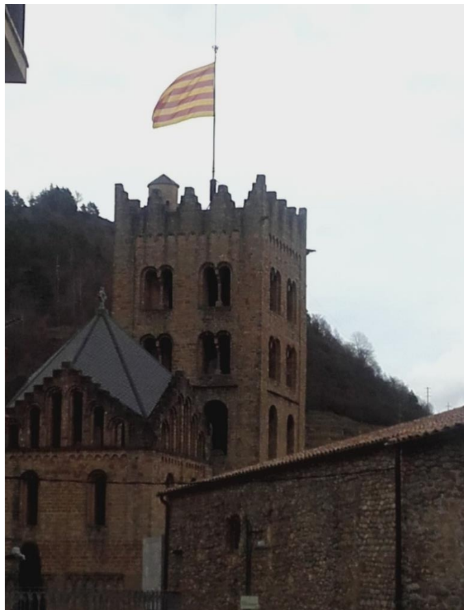
Slika 1: Samostan Santa Maria de Ripoll

Fundacio Eduard Soler se nahaja v mestu Ripoll. To je majhno mesto s približno 11.000 prebivalci na vznožju Pirenejev ob francoski in andorski meji. Skozenj teče reka Ter. Znamenitost tega srednjeveškega mesta, ki velja za zibelko katalonske kulture, je samostan Santa Maria de Ripoll, ki velja za enega od najlepših primerov španske romanske arhitekture.