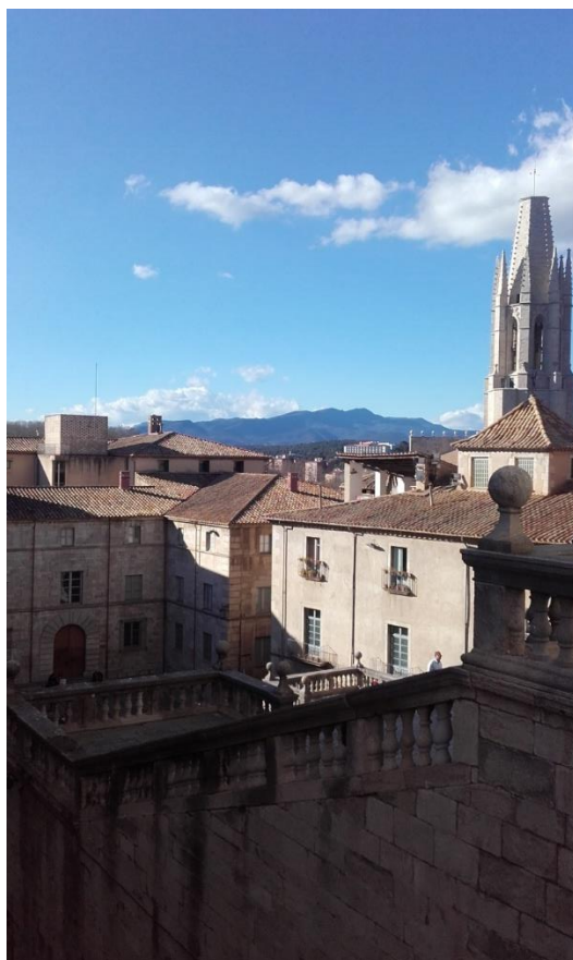
Slika 3: Girona

Obiskala sem tudi mesta na jugu Katalonije kot sta Tarragona in Reus in mesta na obali ob francoski meji srednjeveški Besalu, Figueres in Cadaques.