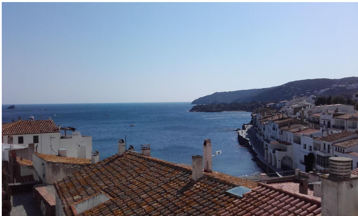
Slika 4: Cadaques

Obiskala sem tudi mesta na jugu Katalonije kot sta Tarragona in Reus in mesta na obali ob francoski meji srednjeveški Besalu, Figueres in Cadaques.