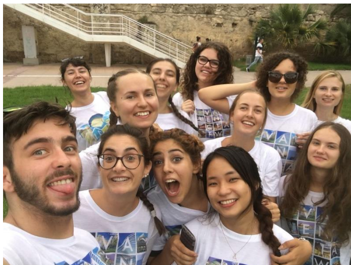
Slika 1: Vse moje sodelavke in jaz v majicah Happy Foreigners World

V podjetju sem tokrat imel kar 11 sodelavk, ki so bile vse iz različnih evropskih držav in smo skupaj opravljali prakso preko programa Erasmus+. Dekleta so bile zelo simpatične in vedno smo našli kakšno priložnost, da se nasmejemo.