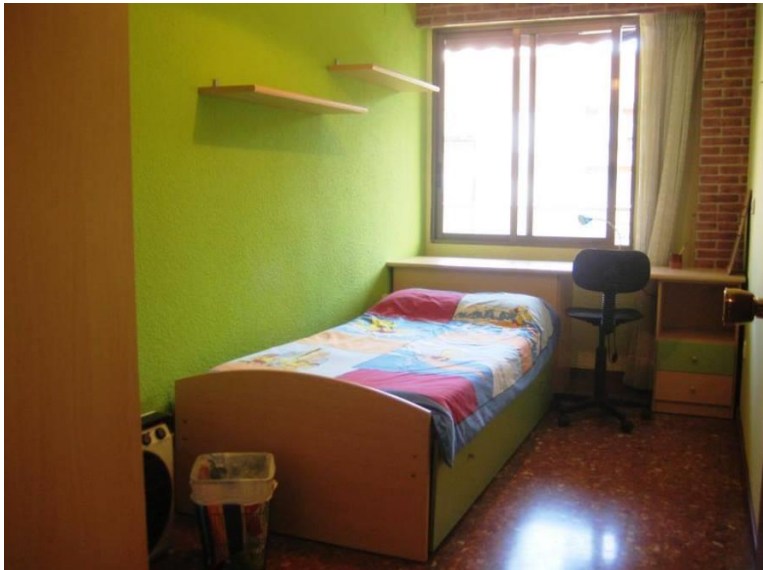
Slika 1: Moja soba

Tokrat sem imel stanovanje zelo blizu Playa de Malvarrosa (Plaža Malvarosa), kjer sem živel s prelepo Rusinjo Elizabeth in smešnim Italijanom Carlom. Stanovanje je imelo eno pomanjkljivost - klimatska naprava ni delovala, zato je bilo zelo vroče.