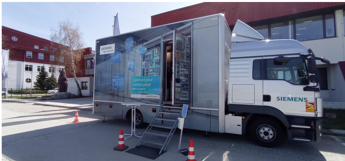
Slika 1: Tovornjak pred vhodom v ŠC Kranj

Obiskovalci smo lahko videli HMI panele, frekvenčne pretvornike, motorje, mehke zagone, motorska zaščitna stikala, tipke, stikala, varnostne module, inštalacijske odklopnike, odklopnike, kontaktorje ter releje.