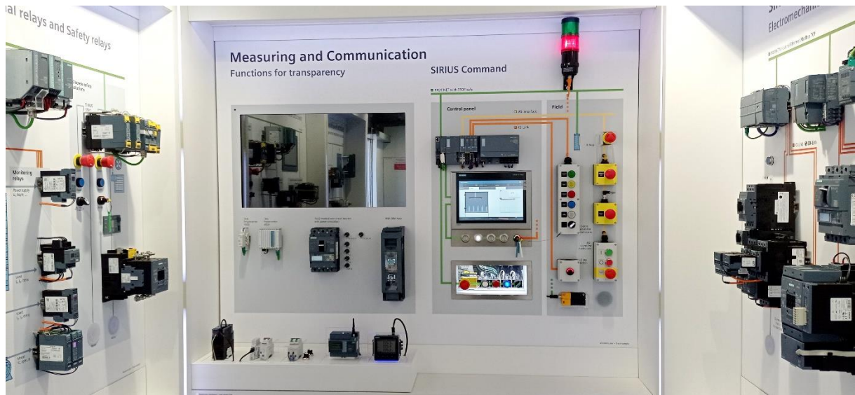
Slika 3: Ukazne tipke in stikala, zaslon na dotika za izvajanje ukazov