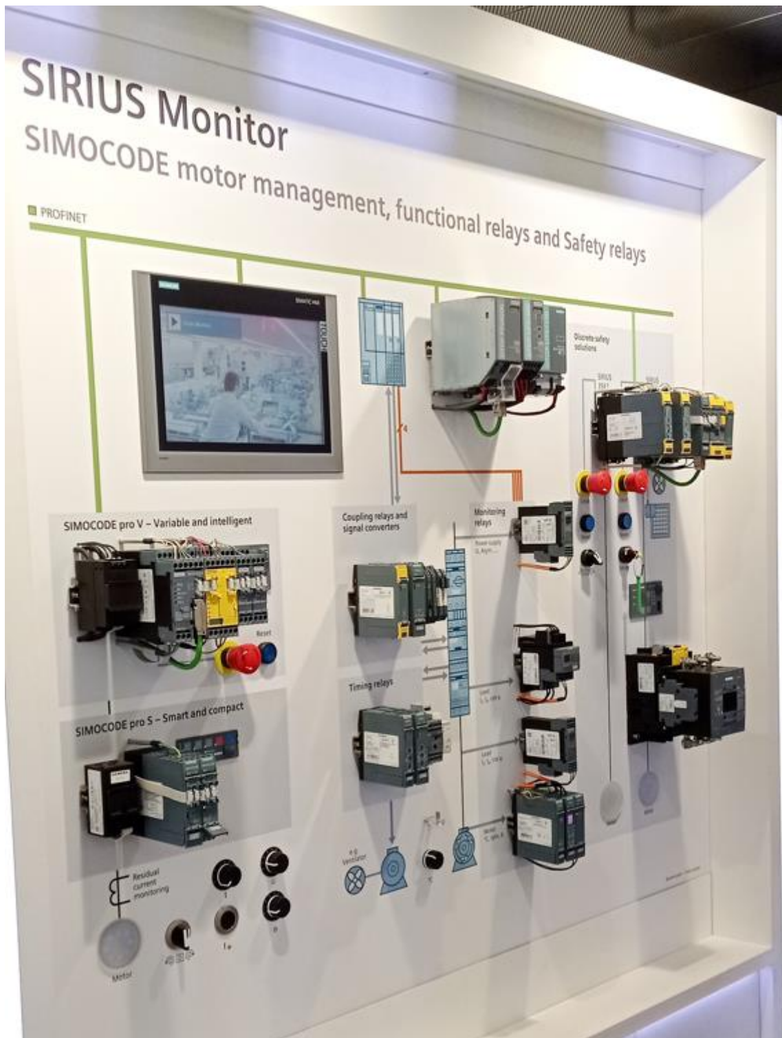
Slika 4: Upravljanje motorjev, funkcijski in varnostni releji