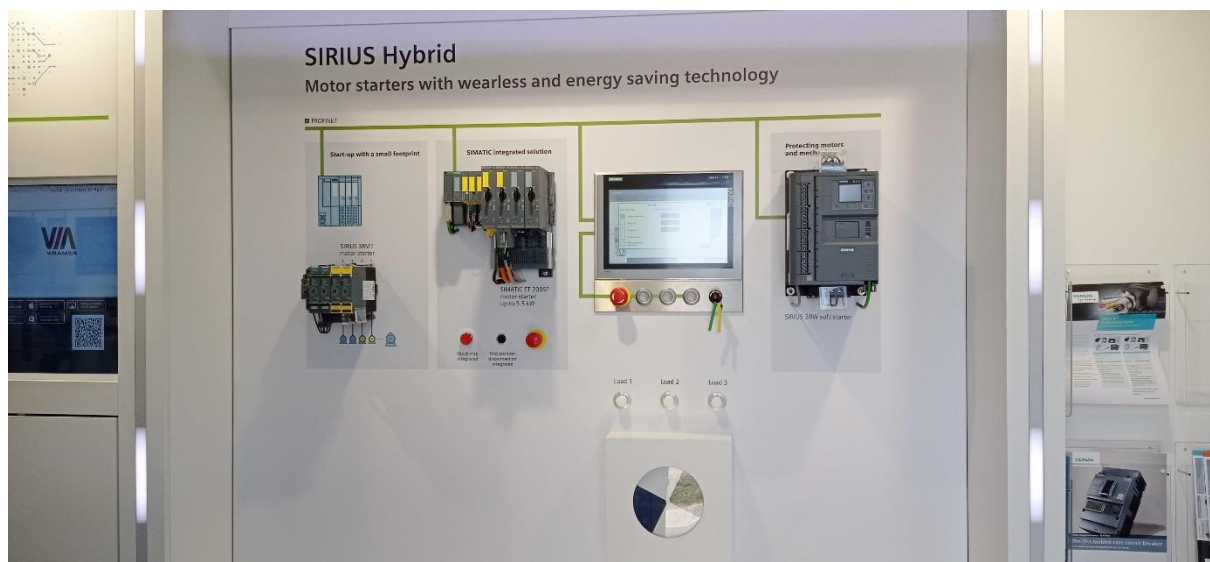
Slika 2: Siemensov krmilnik in modul tirstorskega mehkega zagona