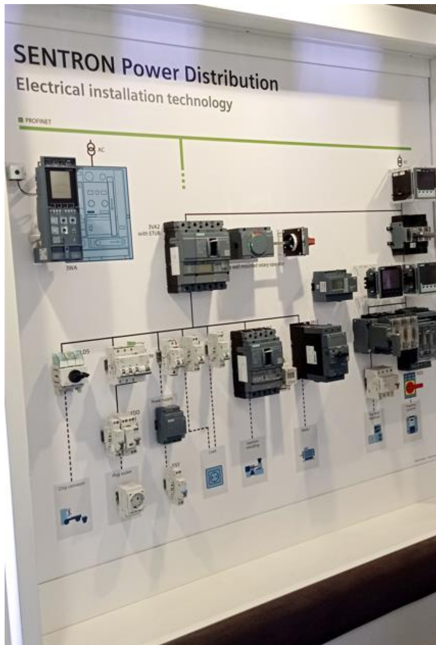
Slika 5: Razdeljevanje energije v obrtnih in industrijskih halah: odklopniki