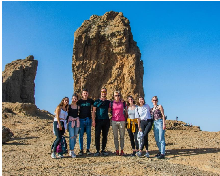
Slika 2 Roque Nublo s študenti erasmusa in VSŠ Kranj

Izven dela šole sem veliko raziskoval po otoku sam ali pa z organizacijo Erasmus, ki je za zelo ugodno ceno organizirala izlete po otoku. Poleg izletov so bili tedensko tudi organizirani razni dogodki Erasmus študentov, kjer sem spoznal zelo veliko študentov, ki so prav tako na praksi ali pa na izmenjavi iz cele Evrope. Športov na tem otoku prav tako ne manjka, saj so veliki ljubitelji surfanja, odbojke na mivki, nogometa, teka in še več. V obdobju dobrih 2 mesecev sem si ogledal veliko muzejev o arheologiji, tehnologiji ter zgodovini otoka, prav tako pa izkoristil Erasmus izlete. Fotografije si lahko ogledate spodaj.