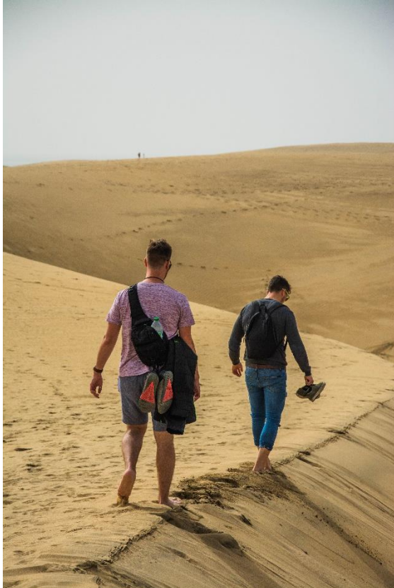
Slika 4 Mas Palomas z dvema VSŠ Kranj študentoma