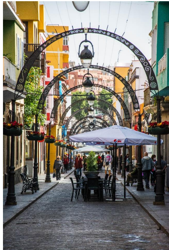
Slika 3 Galdar