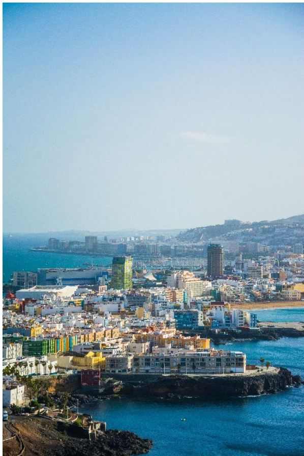
Slika 5 Mesto Las Palmas (levi del)

Ta izmenjava je bila zame res čudovita izkušnja, saj sem pridobil veliko znanja in prijateljev ter izkusil življenje in delo v drugačnem okolju. Rad bi se zahvalil gospe Nastji Beznik, ki mi je omogočila to mobilnost, prav tako se ji zahvaljujem za njeno hitro odzivnost in podporo med opravljanjem prakse v tujini.