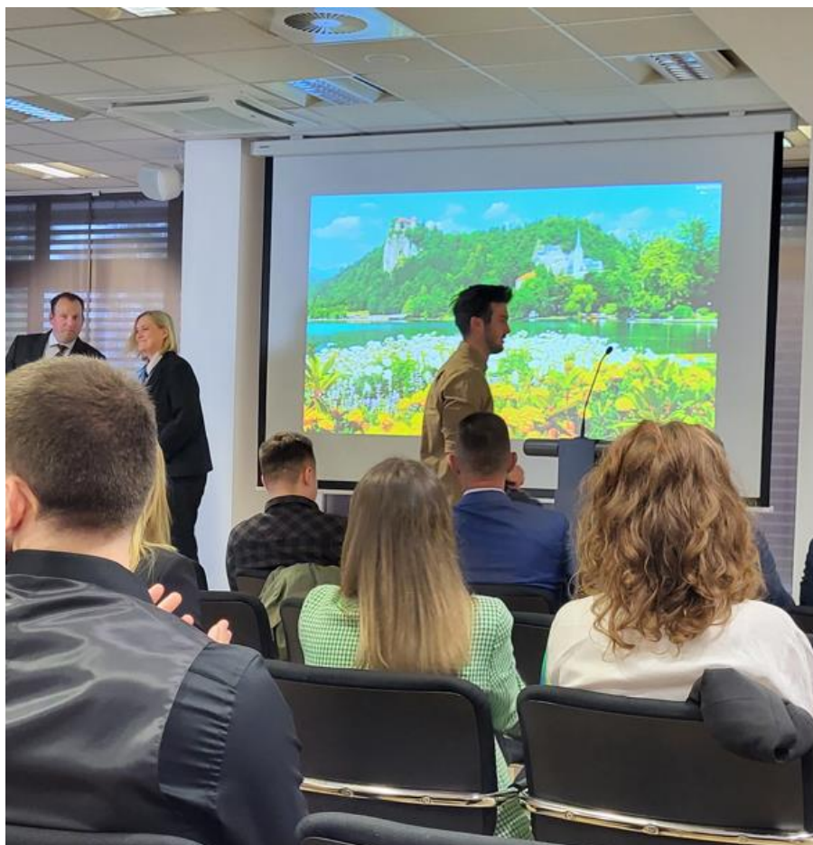
Slika 9: Svečana podelitev diplom 2023/2024, v ozadju Blejsko jezero in grad

Na sklepnem sestanku smo bili enotni, da je priložnosti za povezovanje na mednarodni ravni med akademskim osebjem Akademije uporabnih študij Zahodne Srbije in Višje strokovne šole Kranj veliko in da se bomo še naprej trudili poiskati možnosti in priložnosti za krepitev internacionalizacije z več vidikov, med drugim tudi v smislu širitev mednarodne razsežnosti institucionalnega sodelovanja s pomočjo primerjave izobraževalnih modelov ter izmenjave znanja in najboljših praks v učnih načrtih tehničnih in socialno-humanističnih študijskih programov. Nadaljevali bomo z izmenjavo znanja in izkušenj v zvezi s strukturo, vsebino in metodami izvajanja strokovne prakse med sodelujočimi inštitucijami in še naprej spodbujali razvoj in uporabo sodobnih informacijskih tehnologij med študenti in zaposlenimi na področjih naših izobraževalnih programov.