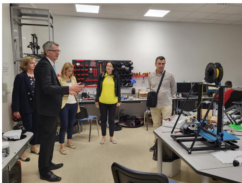
Slika 3: Na ŠC Kranj se lahko pohvalimo s sodobno IKT opremo učilnic