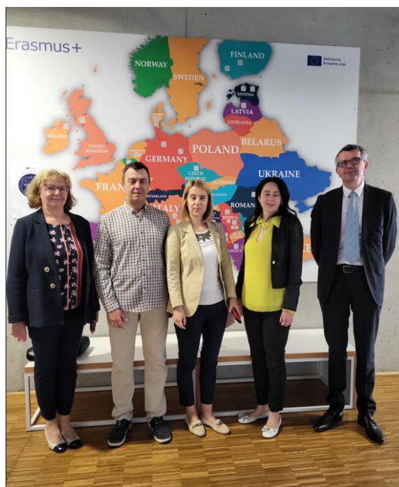
Slika 4: Direktor, gosti in ravnateljica VŠŠ, v ozadju tabla s sodelujočimi državami Erasmus+ ŠC Kranj